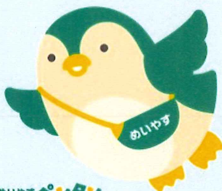
めいやすペンタン